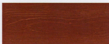
Cedral C 20 (Svenskröd, Faluröd)*