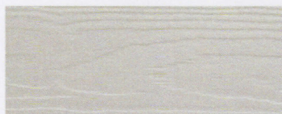
Cedral C 05 (Grå)*