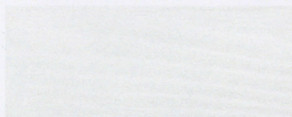
Cedral C 01 (Hvid, hvit, vit)*