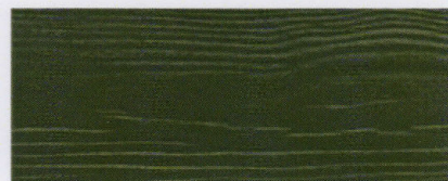
Cedral C 31 (Grøn, grønn, grön) RAL 6009 NCS S 8010 - G 10 Y