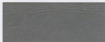
Cedral C 15 (Granit, Granitt)*