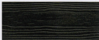
Cedral C 50 (Sort, svart)*